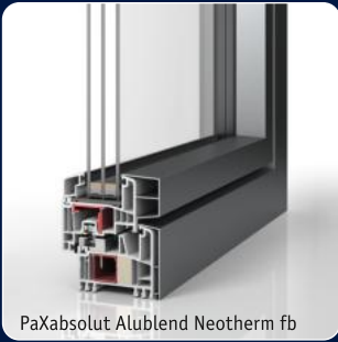
PaXabsolut Alublend Neotherm fb